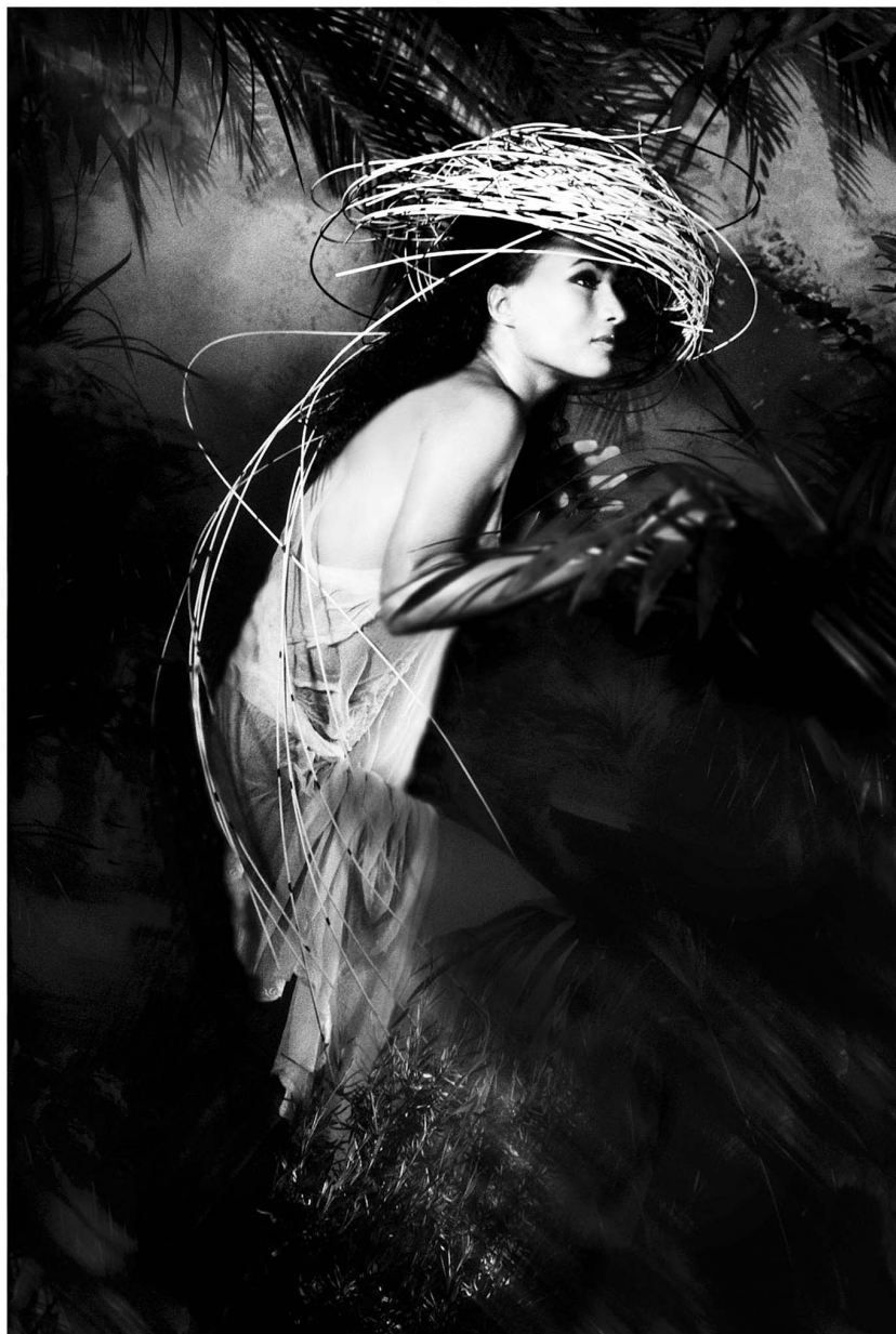
Conception et réalisation photo : Elise Rebiffé. (Léa, 1998).