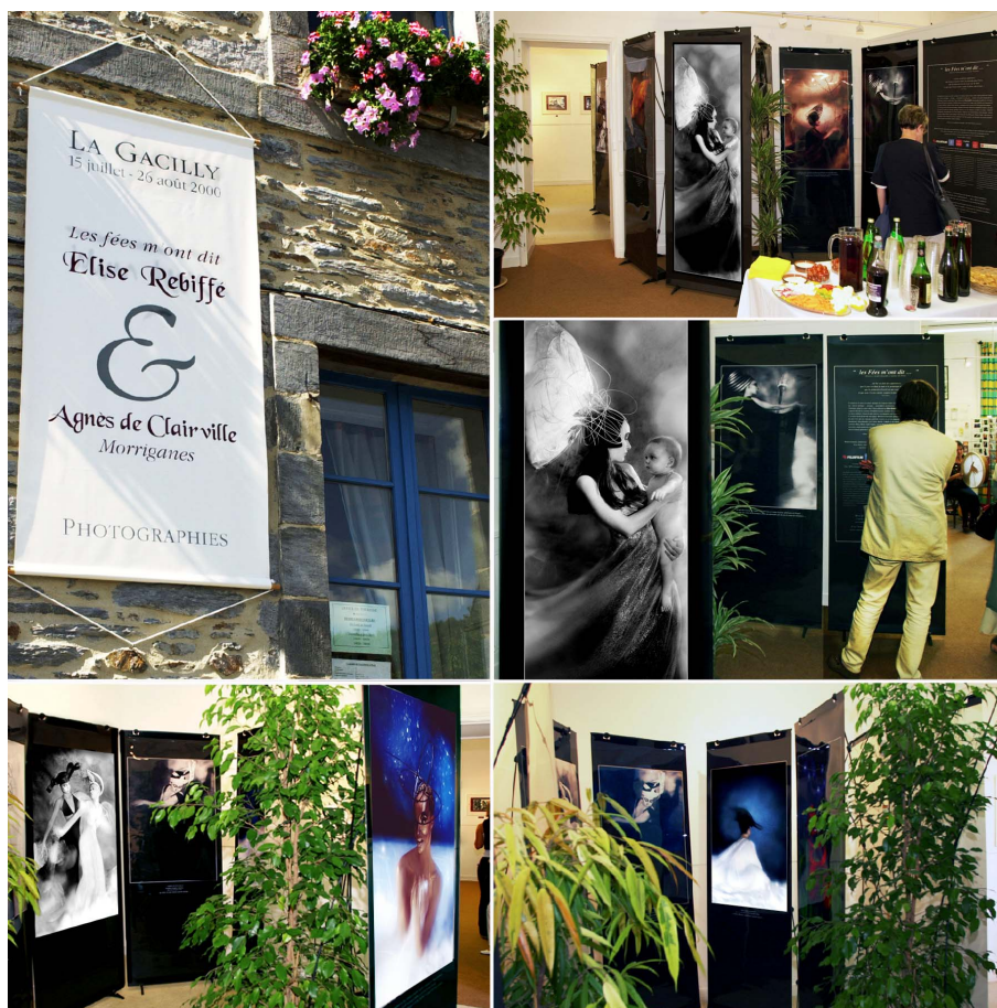
2000, Office du tourisme de la Gacilly, La Gacilly (Bretagne), « Les Fées m'ont dit... »