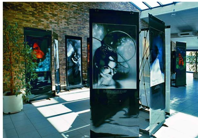
2002, Espace L.Carnot, Médiathèque départementale de l'Essonne, La Ferté Alais.