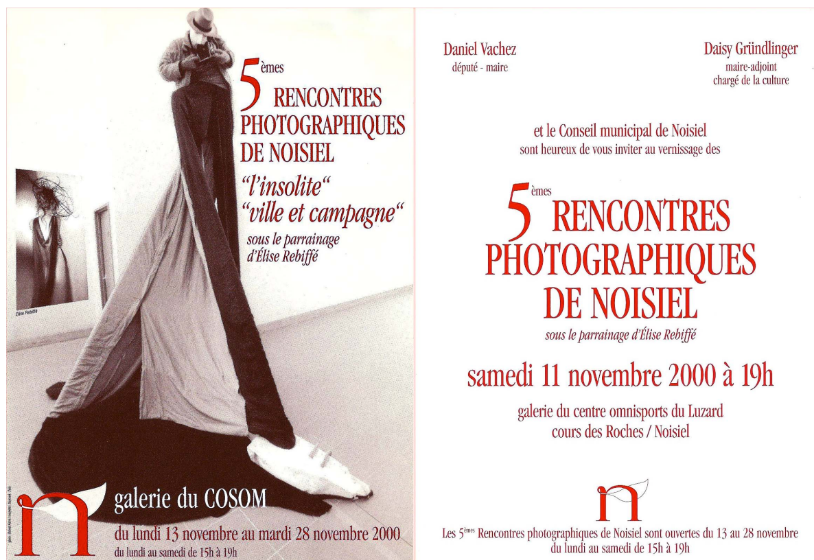
2000, Galerie du COSOM, Parrainage des 5 ème Rencontres Photographiques de Noisiel